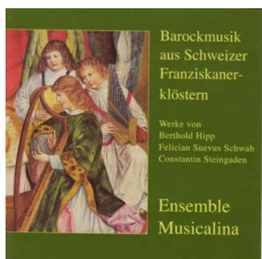
Müller und Schade 5047/2

Motetten, Magnificat, Te Deum von in der Schweiz wirkenden Franziskanern aus dem Barock