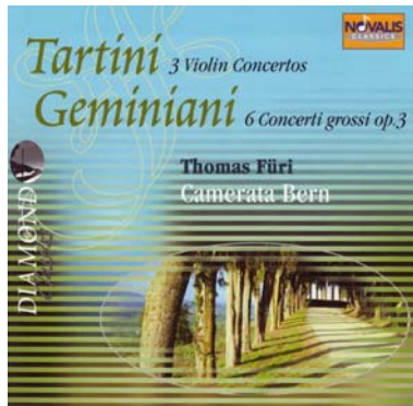
Novalis Classics 150.716-2